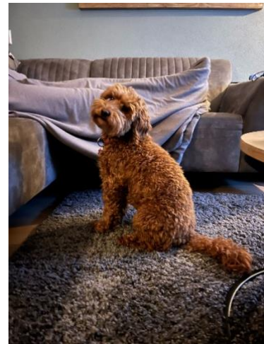
Wat ben je toch een lieve dame 😊

Vandaag had ik een echt ochtendhumeurtje. Ik kwam mijn mandje maar niet uit en had absoluut geen zin om te eten. Al zat ik wel stiekem te azen op de la met lekkers. Ik begin met de dag rustiger te worden.. Vanavond at ik gelukkig wel weer. Voor de rest heb ik ook zeker nog van de zon mogen genieten vandaag!