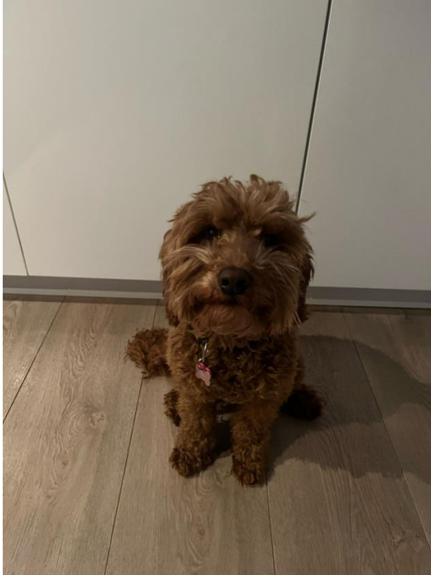
Wachten op iets lekkers in de keuken.