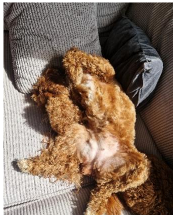
Je slaapt in de meest onmogelijke houdingen op het moment