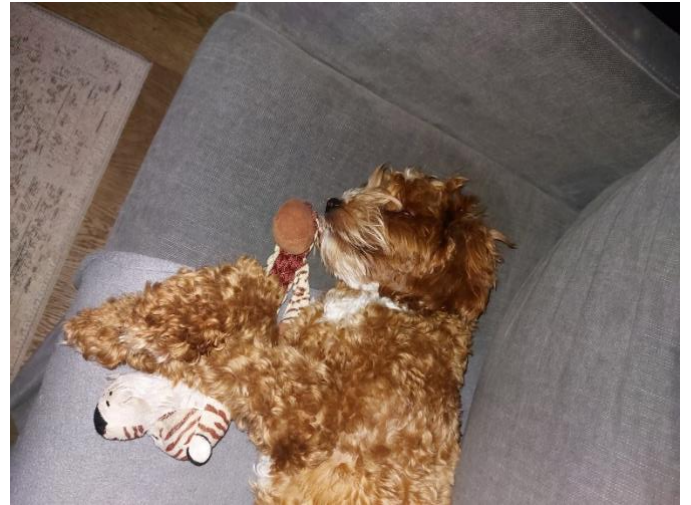
Wat kan je toch heerlijk slapen

Nog een weekje aftellen, dan weten we hoeveel kleintjes er in je buik zitten. Aftellen!