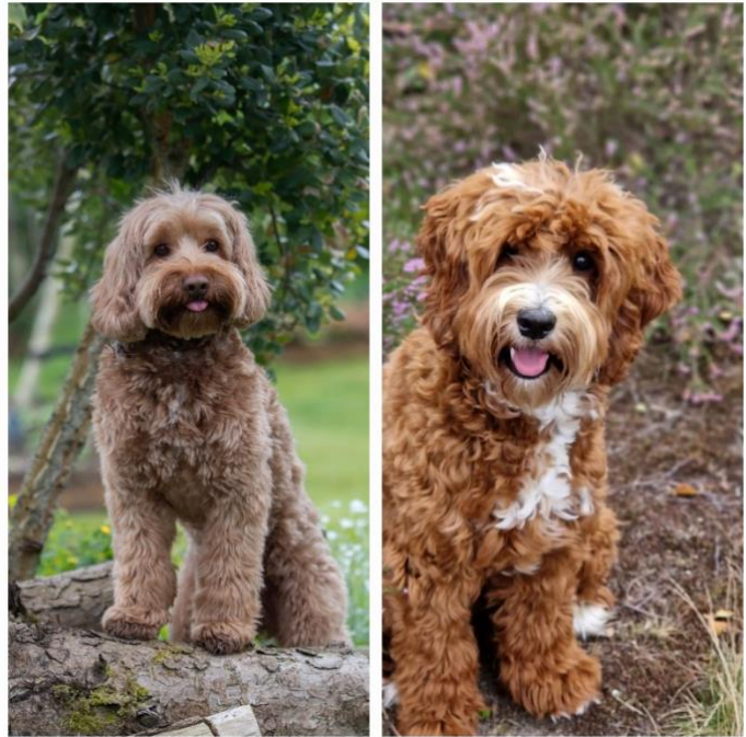
Wat zijn jullie toch een knap stel samen.

Wat is het toch altijd spannend, maar wat vonden jullie elkaar leuk! De dekking was enorm snel een feit, en naderhand hebben jullie nog erg leuk met elkaar gespeeld.