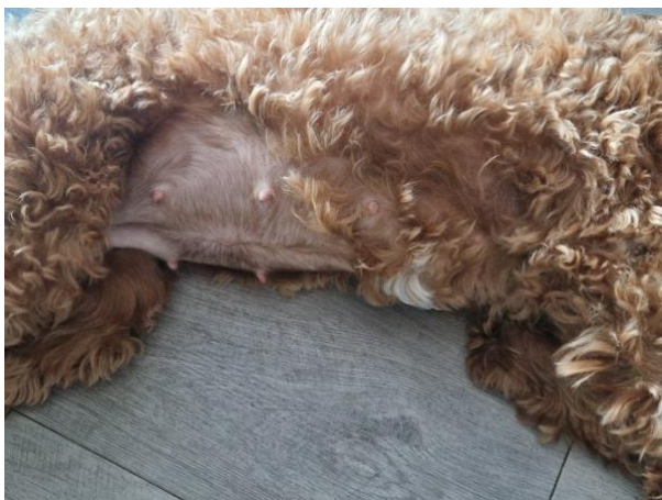
Je mooie buikje begint al steeds ronder te worden!

Deze week is een relatief rustige week. Je bent weer wat minder misselijk, en oogt weer wat vrolijker. Wel ben je super rustig.