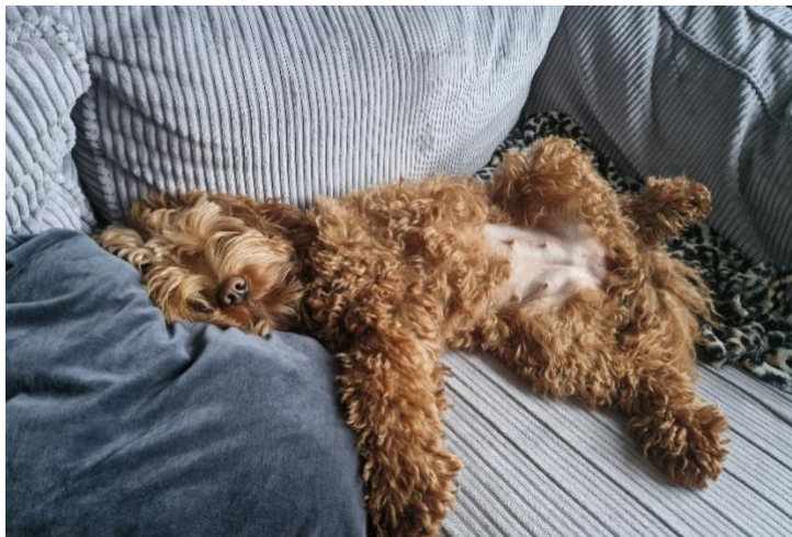
Tijd dat de zon gaat schijnen, dan kan je je buik wat bij bruinen

Vandaag weer een rondje bos gepland met je vriendje. Je vind er echter niet veel meer aan. Je loopt met ons mee, maar wil niets van je grote vriend weten, en je heb zeker geen zin om te spelen.