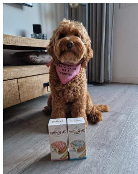
Hoera! je bent echt zwanger!