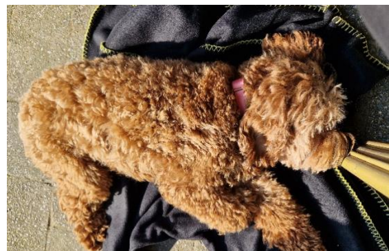
Heerlijk genieten van het zonnetje op het terras

Vandaag gaan we gezellig naar de camping naar opa en oma. Wat ben je blij ze te zien. We hebben je lang niet ZO hard zien rennen als toen je ze zag. Je hebt heerlijk met je balletje gespeeld. En lekker liggen slapen in het restaurant.