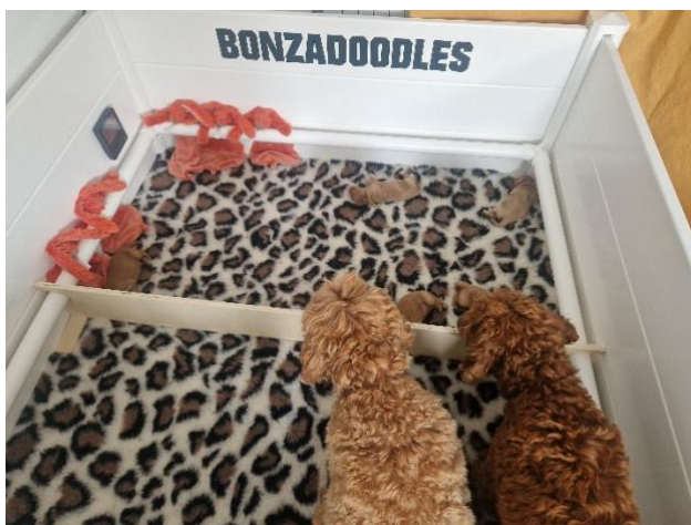
Even op "kraamvisite" bij de ukjes van zusje Pip.

Het spelen met Jet word wat rustiger, het lijkt alsof Jet ook aan begint te voelen dat er iets met je is.