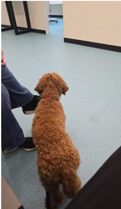
Wachten op de echo bij de dierenarts