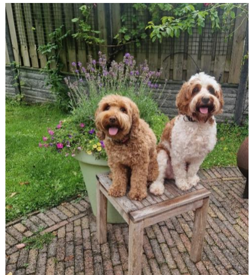
Na de dekking nog even op de foto met lieve Billy